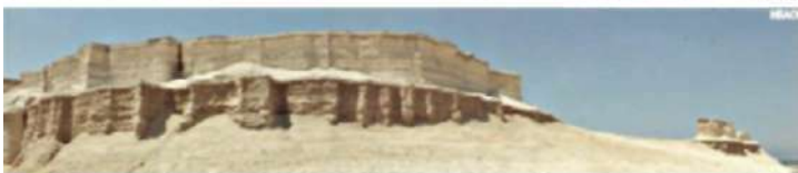
Внешняя стена Гоморры – типично хананейская двойная стена с зубчатой кромкой.

Если города были разрушены 3900 лет назад, как получилось, что пепел не выветрился полностью?