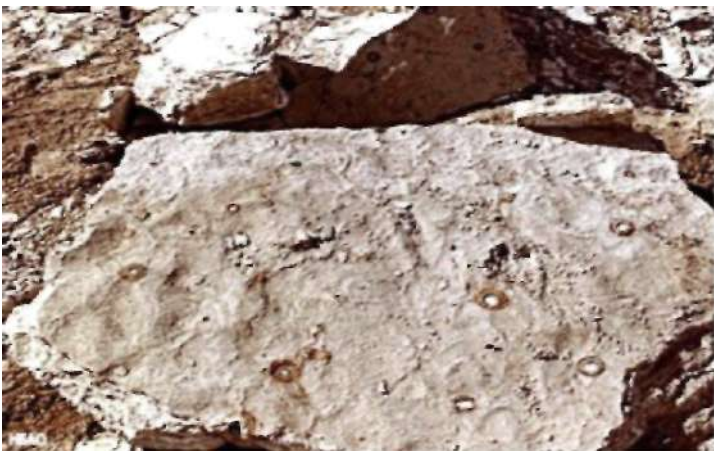
Большой кусок отвалившегося пепельного материала со множеством серных шаров внутри сожжённых капсул.

Материя сожжённой серы оставило пепел, который был тяжелее первоначально несожжённой материи, и это прояснило вопрос, почему пепел этих городов смог сохраниться в течение всех этих 3900 лет.