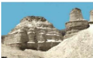
Крутой склон пепельных структур, которые напоминают храм и круглую башню.

шарики на 95-98% состоят из чистой серы. При исследовании, в этих образцах обнаружены примеси-металлы, которые увеличивают количество выделяемой теплоты при сжигании. Она горит при температуре 5000-6000 градусов. Это было проверено в Галбрейской лаборатории в Кноксвилле, штат Теннесси,