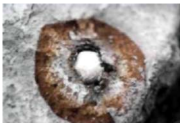
Вверху: серный шар в капсуле. Внизу: капсула с удалённым серным шаром.

серы. После того, как вещество полностью сгорало, к сере прекращался доступ кислорода, и потом происходила капсулизация. В каждой из этих кристаллообразных капсул имеются кусочки серы, размером напоминающие шарики подшипника. И миллионы таких шариков найдены в окружающем пепле. Некоторые были вскрыты и мы можем видеть серу внутри. Таких шариков здесь миллионы. Это явно указывает на то, что Бог излил дождём серу и пламя на эти города.